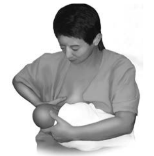
Posición de cuna cruzada o de transición