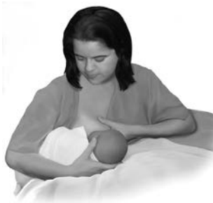
Posición de agarre o de "fútbol"

Existen posiciones diferentes para darle pecho de manera exitosa a su bebé. Es importante encontrar la posición más cómoda para usted y para el bebé. Si es necesario, puede utilizar almohadas o cojines para apoyar tanto sus brazos como al bebé.