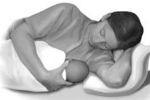
Posición recostada de lado