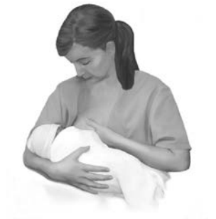
Posición de cuna