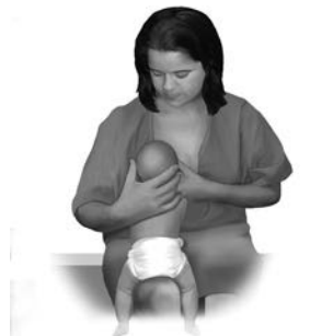
Posición recostada de espalda